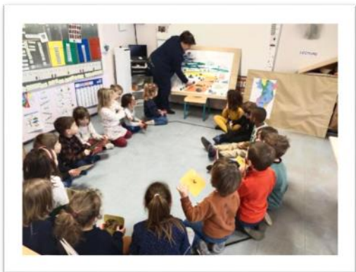
Atelier archéologie à l'école des Bosquets - mars 2023

En ce qui concerne le service périscolaire, nous vous remettrons également les formulaires à remplir ainsi que le règlement du service (cantine et garderie).