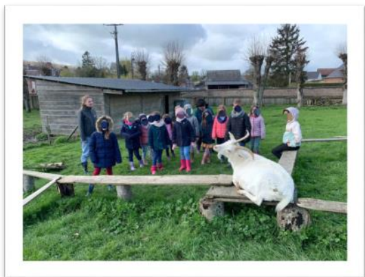
Classe de découverte - avril 2023