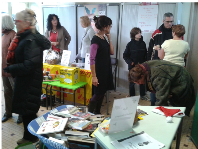
Téléthon et marché de Noël du 8 décembre 2012