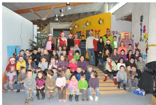
Repas de Noël du 13.12.12

Si vous avez des déguisements pour les petits que vous n'utilisez plus et qui vous encombrent, n'hésitez pas à en faire don à l'école maternelle pour remplir « la malle aux déguisements » !