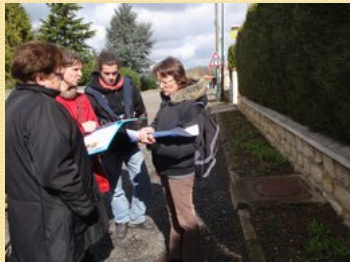
En mars, conception des massifs

Deux samedis sont consacrés à l'opération : un pour choisir les végétaux et composer les massifs sur le terrain en mars et un pour effectuer les plantations en mai. Ces journées particulières sont aussi l'occasion de partager un moment convivial !