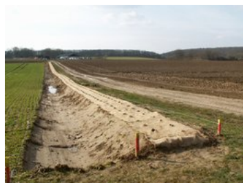
Préparation des zones de plantations février 2009

Les gros orages et le mode de culture intensif génèrent des problèmes de ruissellements importants, d'érosion des terrains et d'apport de limons sur un rû affluent du Sausseron qui est l'objet d'un arrêté de biotope car zone de frayères à truites.