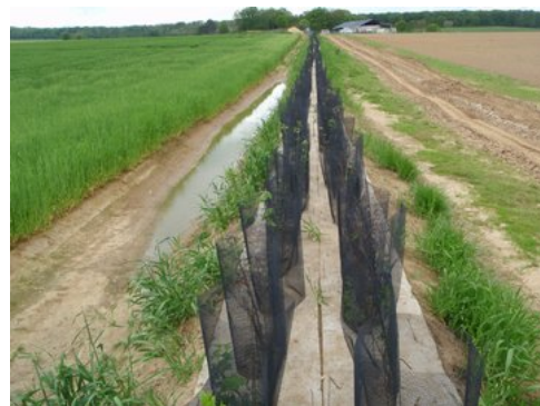
Plantations mars 2009 où le fossé est déjà efficace!