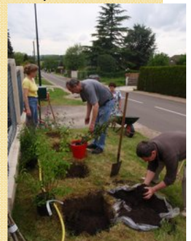
Et de sœentraider !