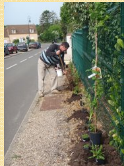
En mai, les plantations ...