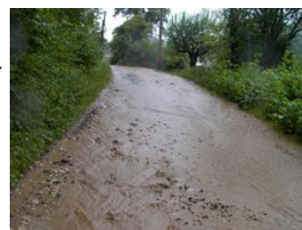
Dégâts des orages mai 2008

D'autres plantations pour préserver la biodiversité ont été effectuées en associant agriculteurs, sociétés de chasse, habitants, parents, enfants au printemps 2009.