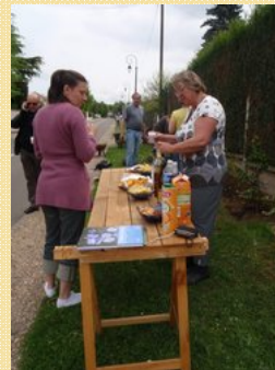
Permettent de rassembler les participants